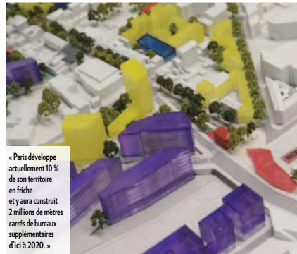
« Paris développe actuellement 10 % de son territoire en friche et y aura construit 2 millions de mètres carrés de bureaux supplémentaires d'ici à 2020. »

ter des affaires (QCA) et de 104 % pour Paris hors QCA. Enfin et surtout, il y a des mouvements en sens inverse, de sièges sociaux ou de centres de recherche qui se créent ou reviennent sur Paris intra-muros : Société Générale Asset Management, Scor, ou encore France Télévisions. Et Paris attire de nombreuses implantations étrangères : Sony Music par exemple, ou ICBC, première banque au monde d'origine chinoise, qui vient d'inaugurer ce mois-ci